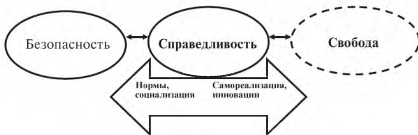
Рис. 1. Базовые ценности социогенеза

Таким образом, в общем случае ценностную ось социогенеза задают безопасность, справедливость и свобода (см. рис.1), причем центральное место на этой оси занимает именно справедливость с ее возможностями акцентировки реализации как в направлении безопасности, так и в направлении свободы. Например, в случае кри-