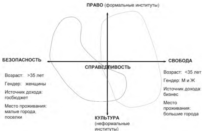
Рис. 4. Социально-демографические профили ценностно-нормативных кластеров

Все сказанное позволяет утверждать, что российское общество имеет дело с серьезнейшим цивилизационным вызовом. И наиболее продуктивным способом ответа на него представляется гармонизация ценностно-нормативного потенциала, образующего российский социум, результатом которой может стать его консолидация на основе солидарности, что, собственно, только и может обеспечить перспективу развития российского общества.